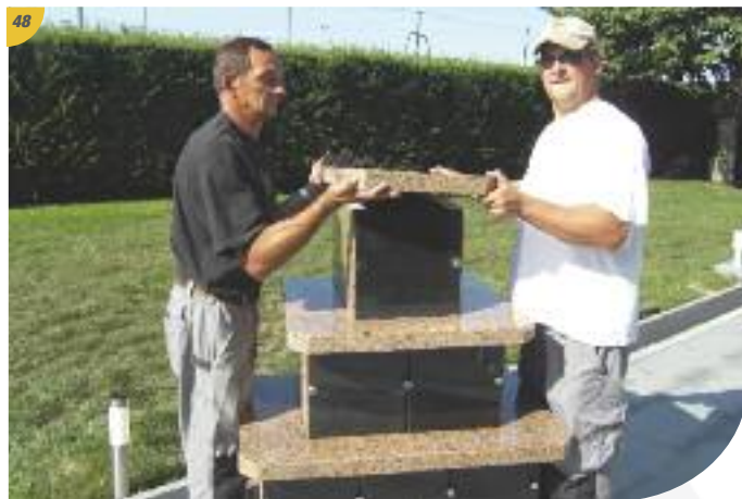
Pose du plateau de couverture du deuxième étage.