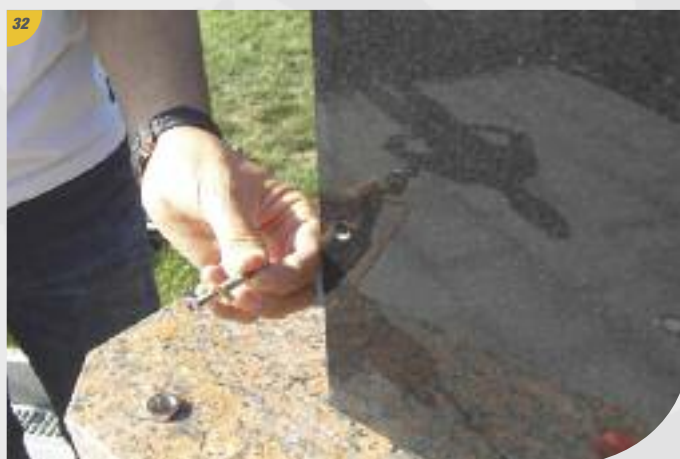
32 Mettre les portes noires en place. Les portes percées s'utilisent pour les extérieurs.