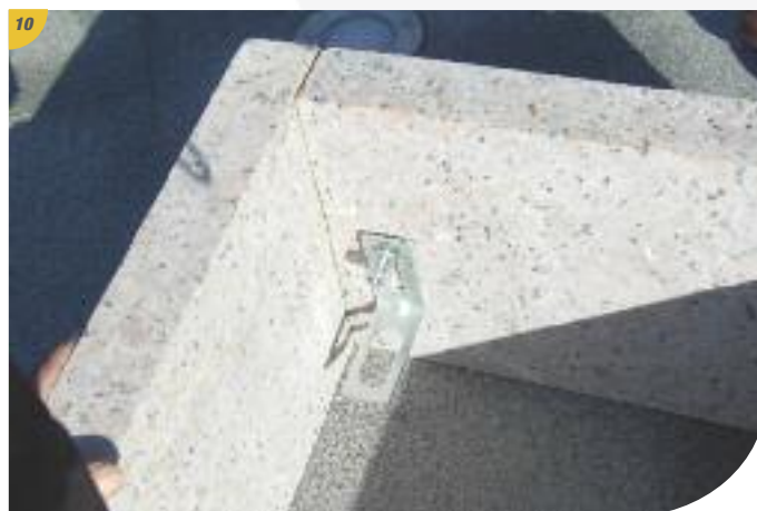
Mettre en place l'équerre et les rondelles.