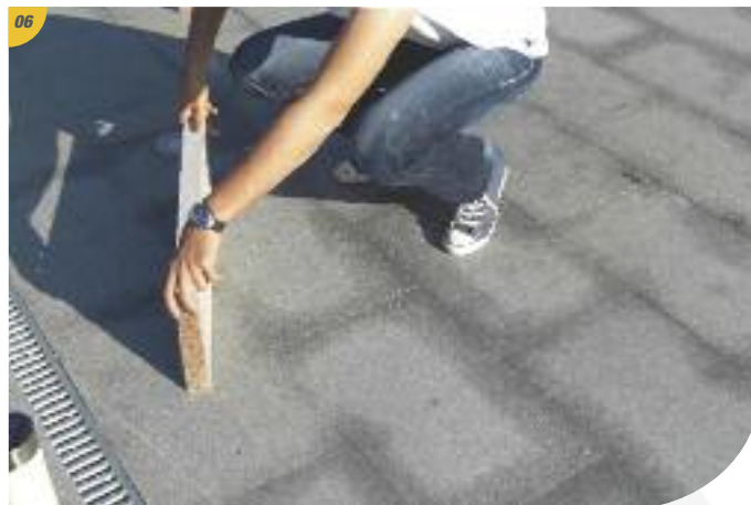
Consulter les plans numérotés (page 10) et se munir des pièces de rehausse.