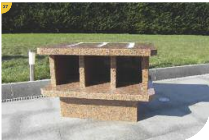
Photo repère, les portes toujours en place.