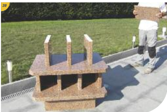
Continuer le montage du 2 e étage sur la même base que le 1 er étage (commentaire images 18 à 28).