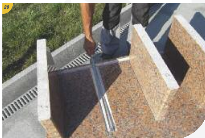
Prendre les mesures pour le repérage avant la mise en place des cloisons verticales.