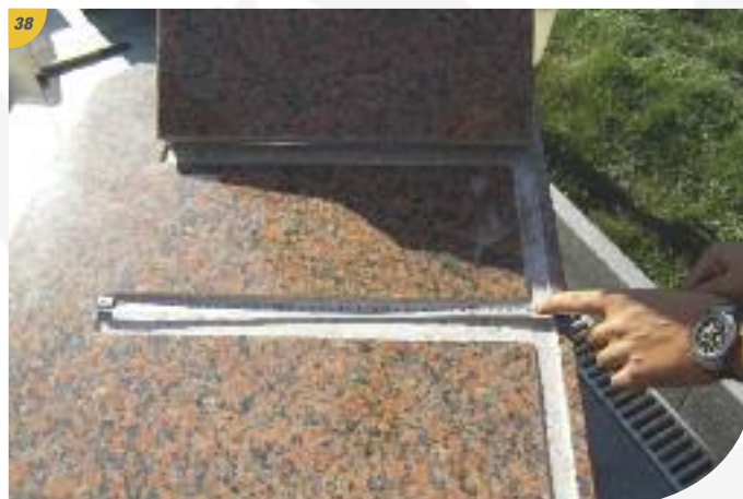
Prendre les mesures pour le repérage avant la mise en place des cloisons verticales.