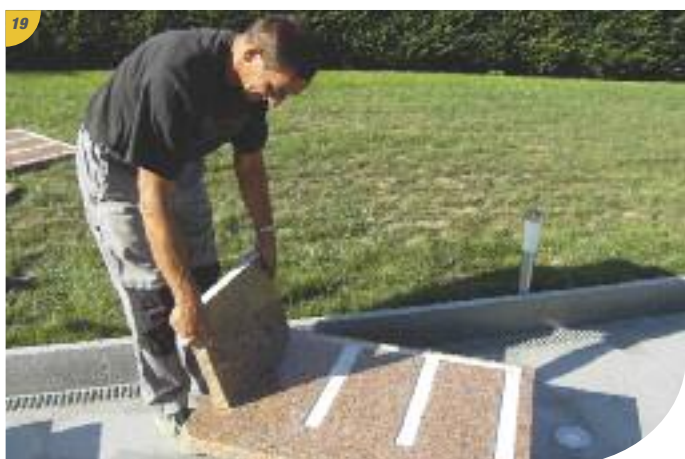
Mise en place des cloisons verticales. (Les trous vers l'avant).