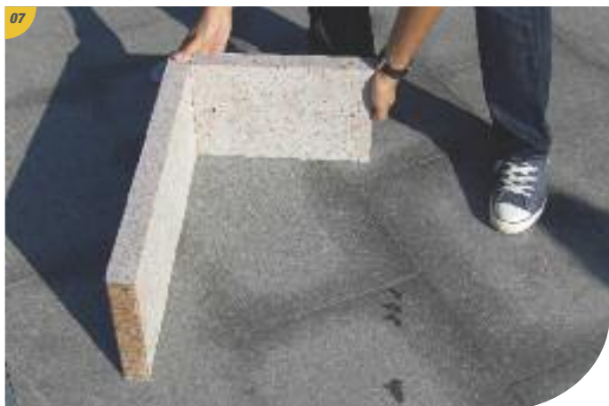
Mise en place de la rehausse.