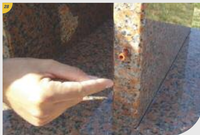
28 À cette étape, insérer les chevilles dans les trous.