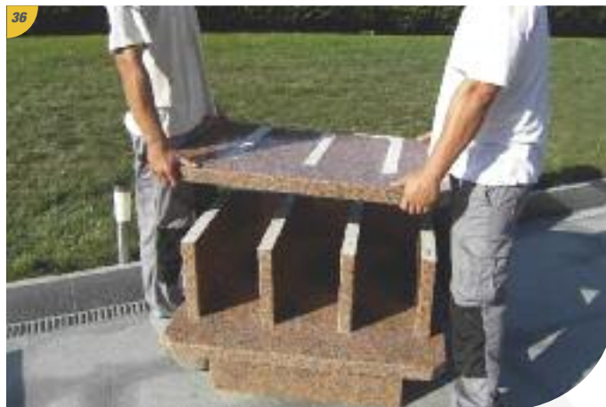
Mise en place du plateau supérieur (attention à l'ajustement des rainures dessus/dessous), les portes toujours en place.