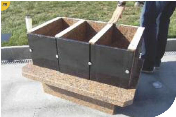
Les portes sont mises en place.