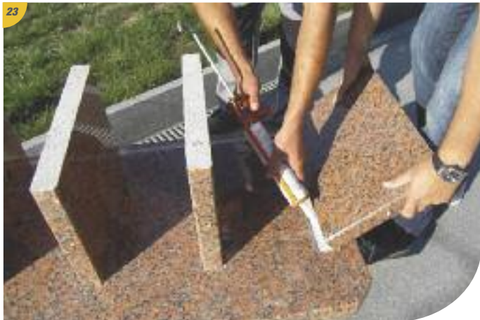
23 Coller les cloisons sur le plateau et les ajuster à l'aide d'un maillet. Encoller également les arrières bruts.