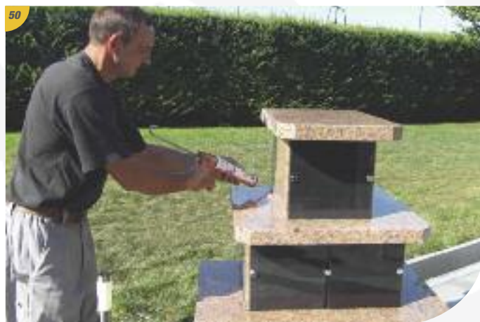
Faites tous les joints extérieurs.