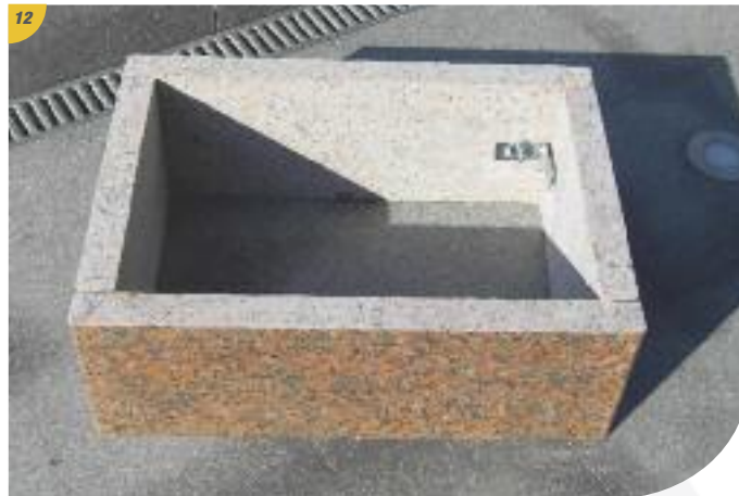
12 La rehausse est prête à accueillir le plateau.