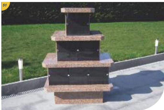
Le montage est à présent terminé.