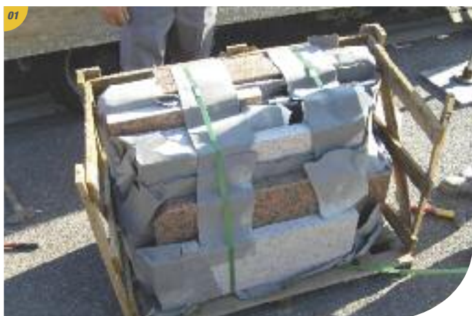
Après avoir soigneusement ouvert la caisse en bois, votre columbarium se présente comme ci-dessus.