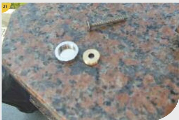
31 Séparez-en les 2 parties, prenez une vis.