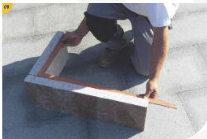
Assemblage et réglage à l'équerre.

À cette étape, le perçage ou le reperçage des trous de cheville peut être nécessaire à l'aide du foret fourni.