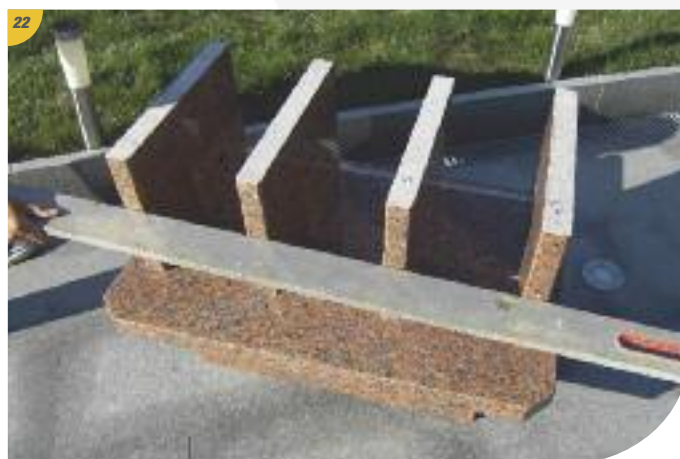
Contrôler à la règle l'alignement avant des cloisons (au maximum de l'avancée dans les rainures).