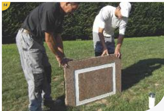
14 Préparer le premier plateau.