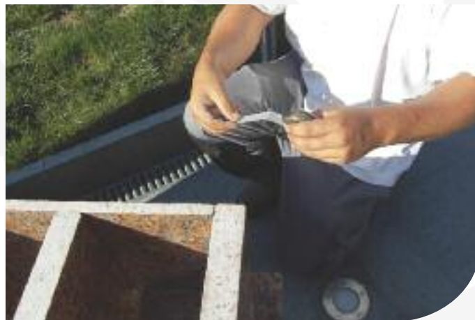
Le dos est à scotcher pour éviter toute chute.