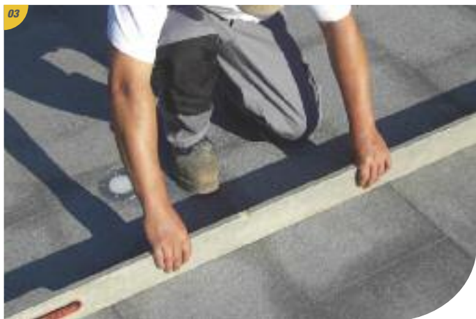
Vérifier le niveau sur toute la surface.