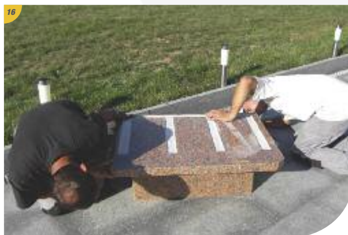
16 Mise en place du plateau sur la rehausse en le "clipsant" dessus.