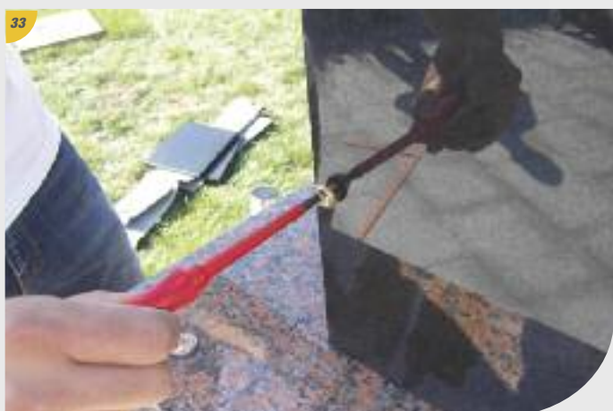
33 Visser les portes.