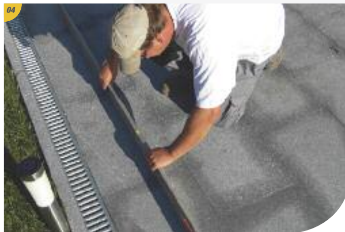
Réalisée au préalable et sèche, votre fondation béton doit être parfaitement de niveau.