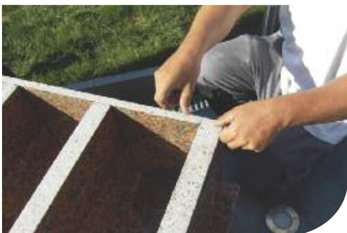
Le dos est à scotcher pour éviter toute chute.