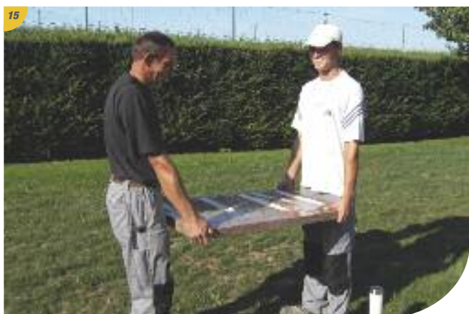
15 Pour plus de sécurité, manœuvrer les pièces à deux.