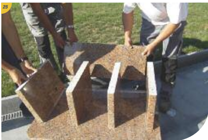
25 Mise en place du dos de fermeture, en ayant encollé toutes les cloisons verticales au préalable.