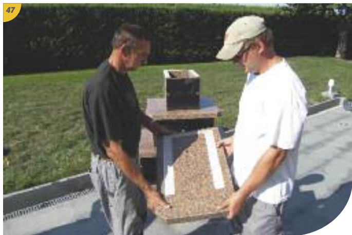
Pour plus de sécurité, manœuvrer les pièces à deux.