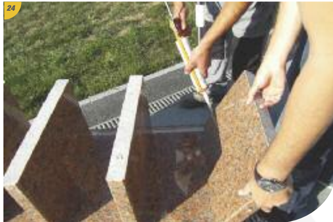
24 Appliquer les joints dans chaque case.