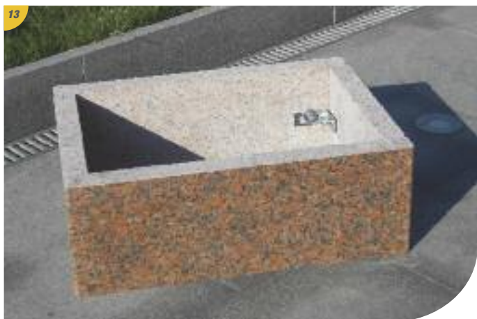
13 La rehausse est prête à accueillir le plateau.