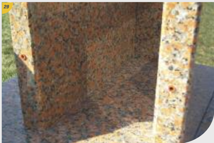
29 Photo repère.