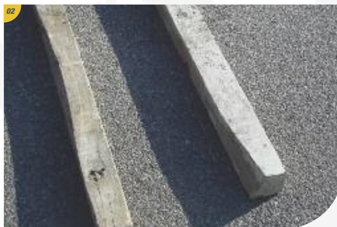
Avant de couper les cerclages, prévoir des cales en bois pour la mise à plat des plateaux. Tenez les pièces pour qu'elles ne tombent pas et ne se cassent.