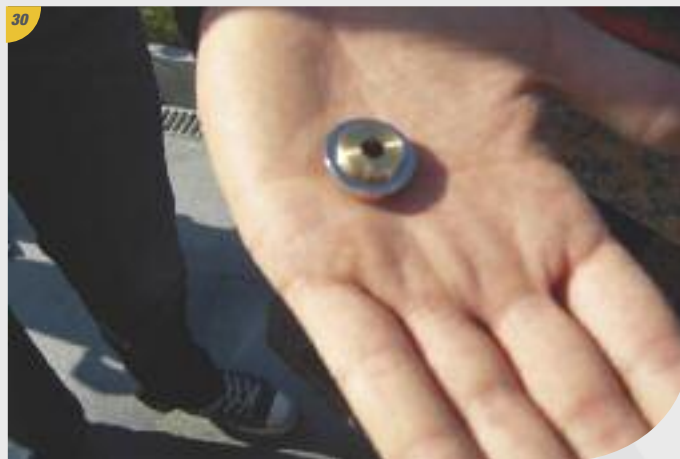
30 Munissez-vous des rosaces.