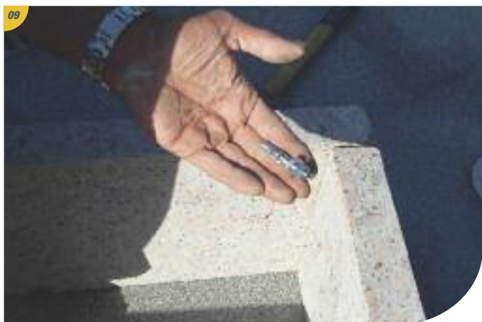
Se munir d'équerres, de chevilles, de rondelles pour fixer la rehausse.

À cette étape, le perçage ou le reperçage des trous de cheville peut être nécessaire à l'aide du foret fourni.