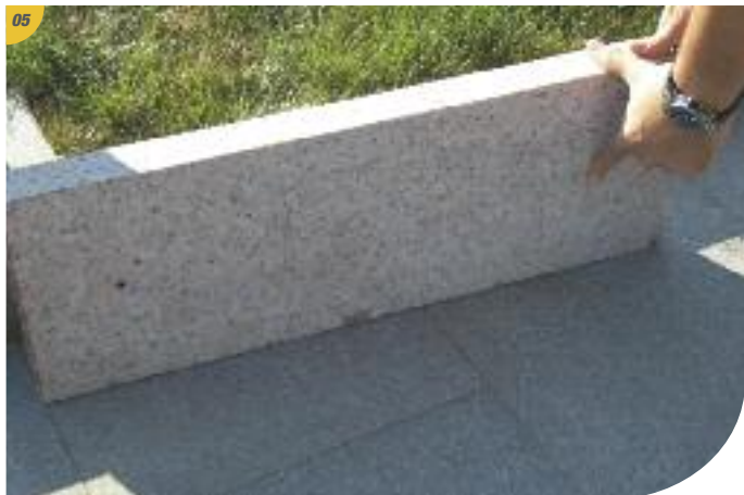
Consulter les plans numérotés (page 10) et se munir des pièces de rehausse.