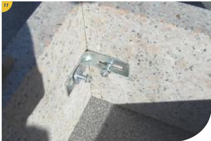
11 Visser à la clé de 13 en prenant garde que l'équerrage soit conservé.