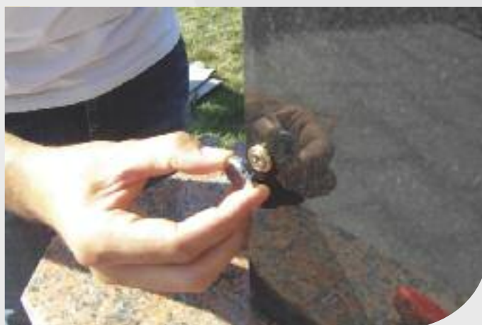
Fixer les rosaces sur les vis.