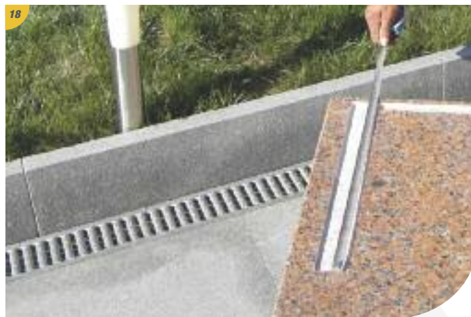
Prendre les mesures pour le repérage avant la mise en place des cloisons verticales.